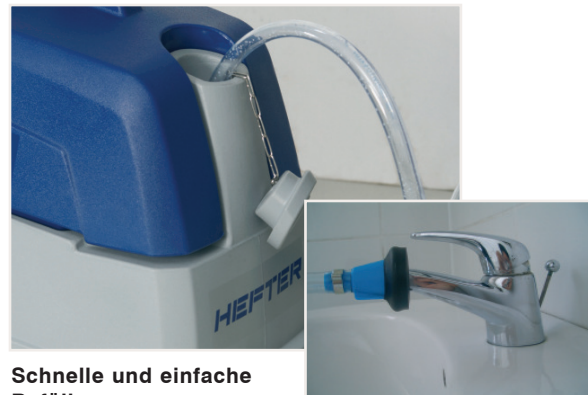
Schnelle und einfache Befüllung 15 Liter Tankvolumen für eine kleine Ewigkeit