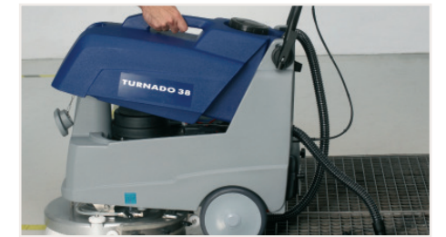
Eine saubere Sache. Der geschlossene Schmutzwassertank lässt sich einfach und unkompliziert ohne etwas zu verschütten entleeren.

Die TURANDO 38 hat Idealmasse für kleine Räume und für relativ enge Platzverhältnisse. Mit ihrer Reinigungsleistung von 1200 Quadratmetern pro Stunde entzieht sie dem Mop schlichtweg die Berechtigung. Den Mop tauchen Sie immer wieder ins gleiche, bereits verunreinigte Wasser. So verteilen Sie den Schmutz immer wieder neu. Die TURANDO 38 hingegen benützt für jeden Zentimeter frisches Wasser. Zudem ist der Boden sofort wieder trocken. Deshalb können Sie sogar während des normalen Betriebs reinigen.