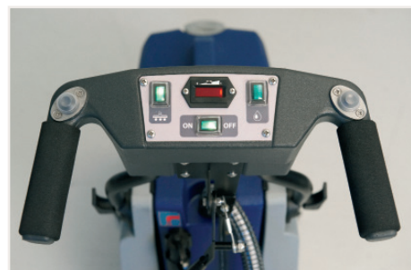
Die Bedienung geht fast von alleine Übersichtliches, selbsterklärendes Display