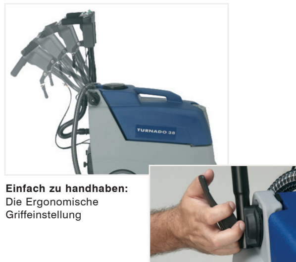
Einfach zu handhaben: Die Ergonomische GriffEinstellung