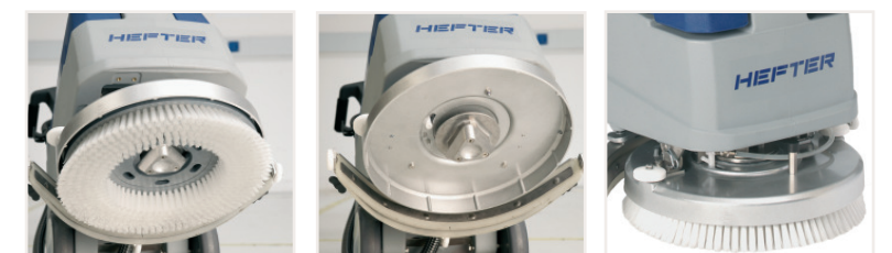
Werkzeugloser Bürstenwechsel. Bürste zum Entnehmen einfach drehen, zum Einlegen nur unter die Maschine legen. Bürste selbstfängend.