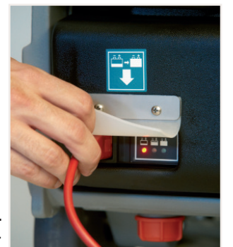
Ladegerät onboard. Einfach nur anstecken.