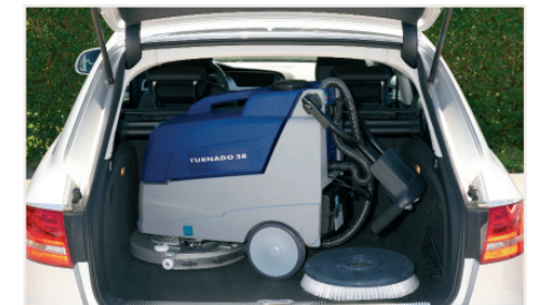
Einfacher Transport Passt in nahezu jeden Kofferraum.