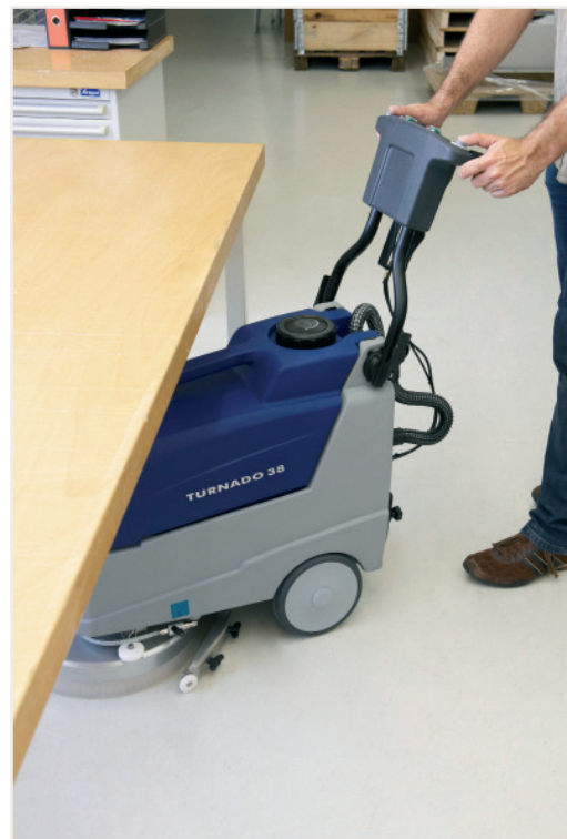
Überstellte Flächen - kein Problem dank kompakter Bauweise Höchste Reinigungsqualität und Hygiene dank professioneller Scheuersaugmaschine in kompakter Klasse