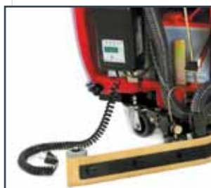
ON-BOARD BATTERY CHARGING INTEGRIERTES BATTERIELADEGERÄT ON-BOARD OPLADEN VAN BATTERIJ