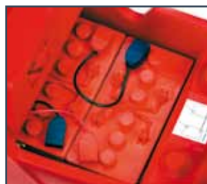
NO.2 12V-110 Ah (20h) BATTERIES* 2 BATTERIEN 12 V-110 Ah (20h) 2 BATTERIJEN 12 V-110 Ah (20h)