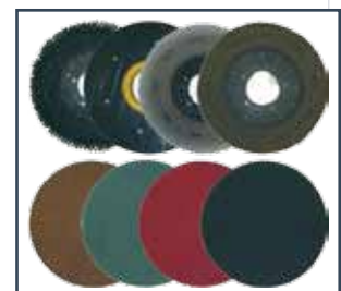
BRUSHES, DRIVE DISKS AND ABRASIVES BÜRSTEN, MITNEHMER- UND SCHRUBBSCHEIBEN BORSTELS, PADHOUDERS, PADS