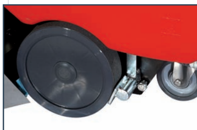
PARKING BRAKE FESTSTELLBREMSE PARKEERREM