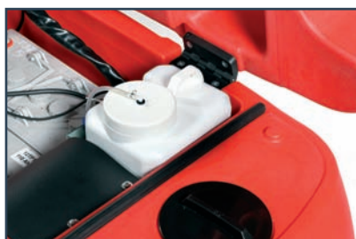
ON BOARD DETERGENT DISPENSER ON-BOARD- DOSIERANLAGE FÜR REINIGUNGSMITTEL ON-BOARD DOSEERSYSTEEM