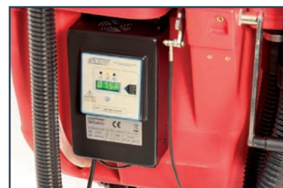
ON BOARD BATTERY CHARGER ON-BOARD-LADEGERÄT ON-BOARD BATTERIJLADER