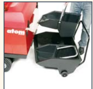
HOPPER PAILS (ATOM PLUS) BEUTEL FÜR KEHRGUTBEHÄLTER (ATOM PLUS) EMMERS VOOR VUILAFVOERSYSTEEM (ATOM PLUS)