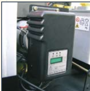
ON-BOARD BATTERY CHARGER INTEGRIERTES BATTERIELADEGERÄT INGEBOUWDE ACCUPLADER