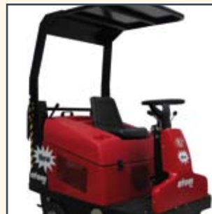
TETTuccio TECHO TOIT DE PROTECTION