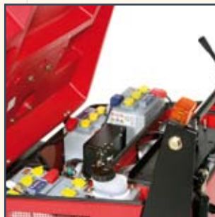
4 X 6V-180AH (5H) BATTERIES 4 BATTERIEN 6V - 180AH (5H) 4 6V-180AH (5H) ACCU'S